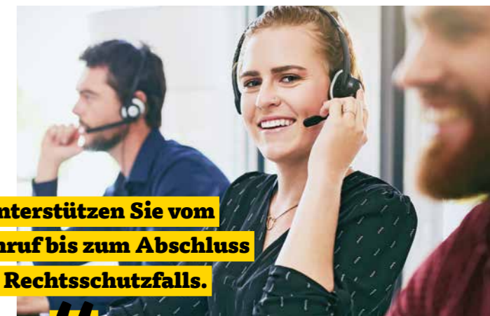
ARAG Mediation, Seite 22

„Wir unterstützen Sie vom ersten Anruf bis zum Abschluss Ihres Rechtsschutzfalls.“